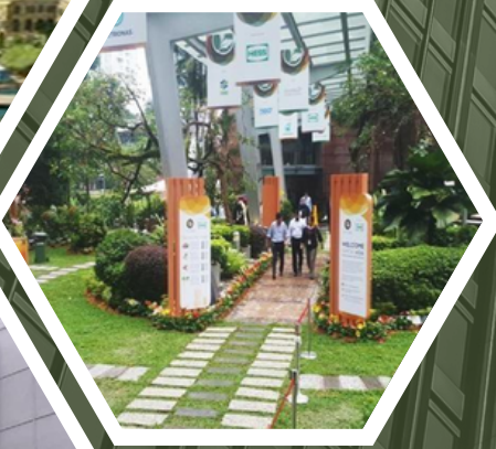
KLCC CONVENTION CENTRE KL