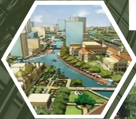
RIVER OF LIFE (ROL) DBKL