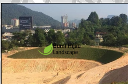
SUKE HIGHWAY PROJECT