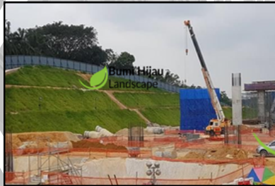
(MRT) V209, CYBERJAYA HYDROSEEDING