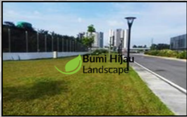
BANK NEGARA MALAYSIA BATU 3, SHAH ALAM