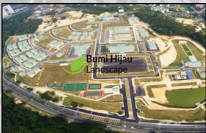
SULTAN JOHOR ARMY CAMP LARKIN