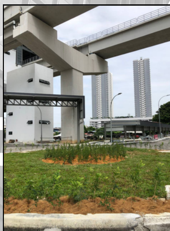
LRT 3 KAYU ARA