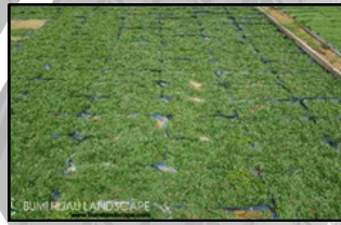
PEARL GRASS (MUTIARA)