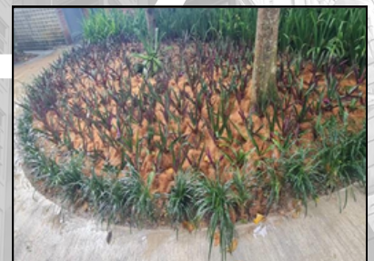
GENTING HIGHLAND (KEMPAS GVR)