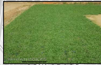
COW GRASS (CHANGKAT TYPE/ ROOL TYPE)