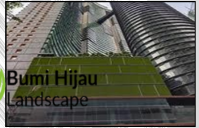
SKY SUITE KLCC , JALAN P. RAMLEE