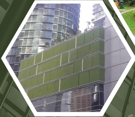
SKY SUITE KLCC (ARTIFICIAL GRASS)