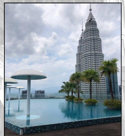
SKY SUITE KLCC LANDSCAPE PROJECT AT LEVEL 6 & 62