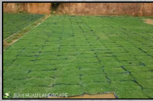
CARPET GRASS (JAPANESE/PHILIPPINE)