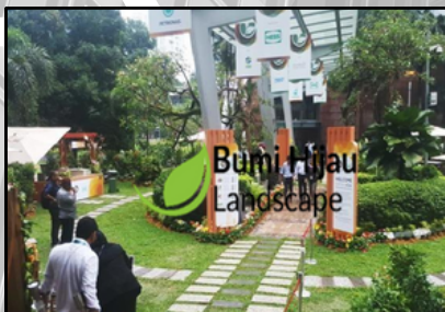
KLCC CONVENTION CENTRE EVENT